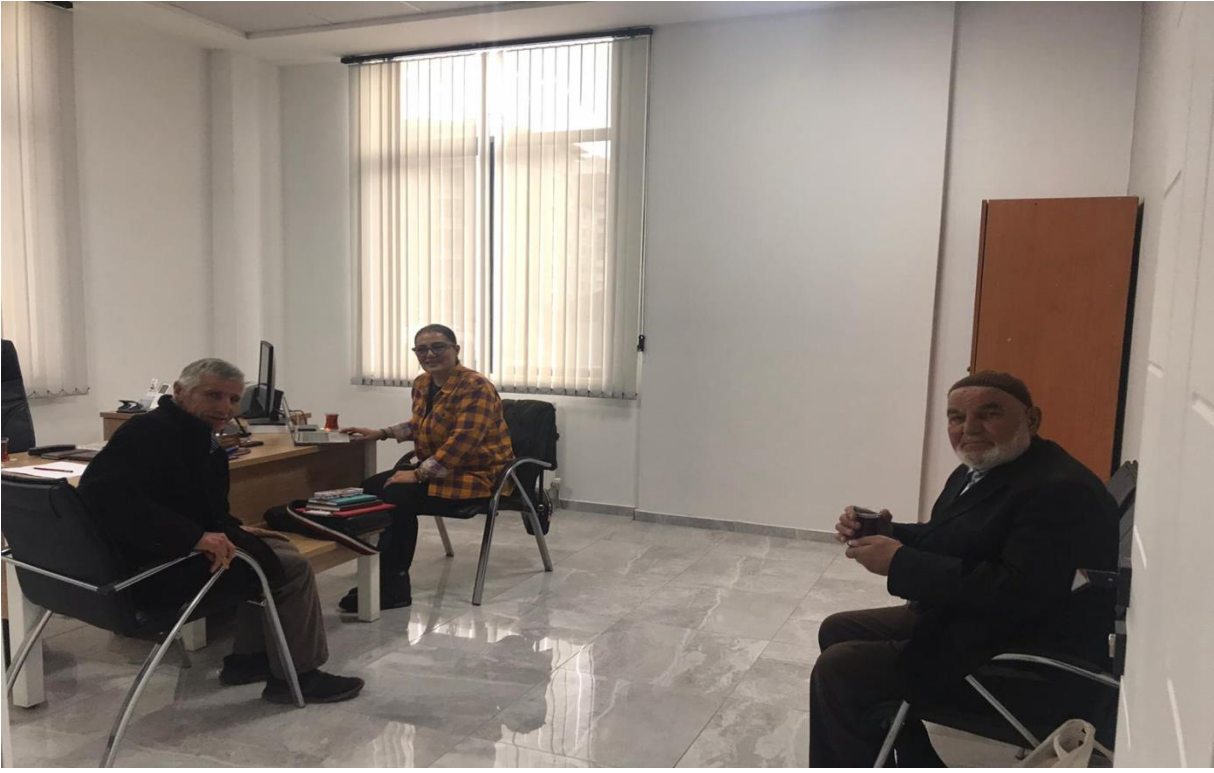
Aşağı Mahalle Sakinlerinden